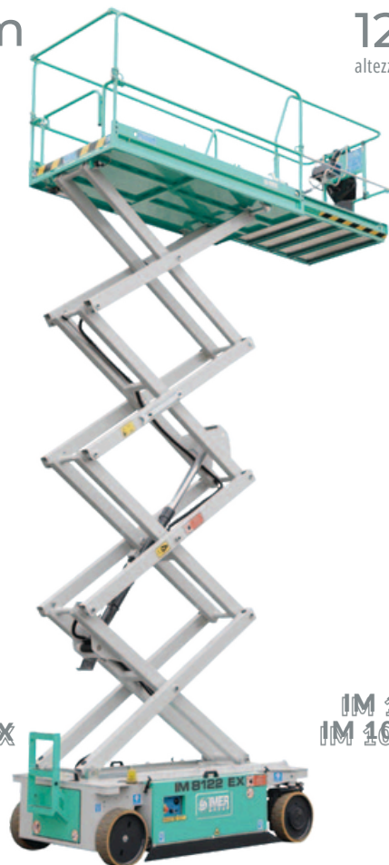
IM 8122 IM 8122 EX