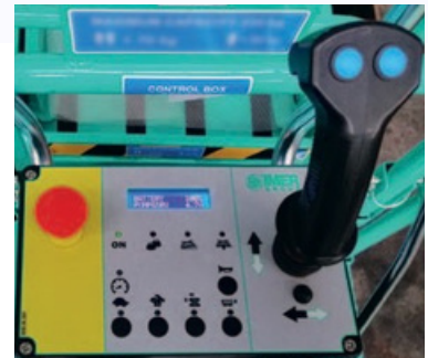
Quadro comandi sulla piattaforma con pulsanti capacitivi: semplicità e sicurezza di utilizzo