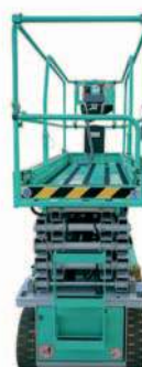
Nuovo design della PLE e della struttura forbice