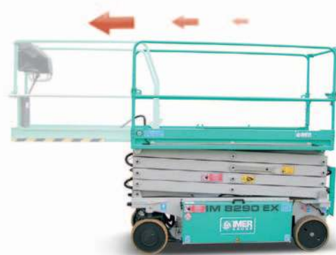
Estensione manuale piattaforma 1,3 m