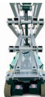
Design del carro base che permette una facile pulizia ed assicura protezione ai componenti