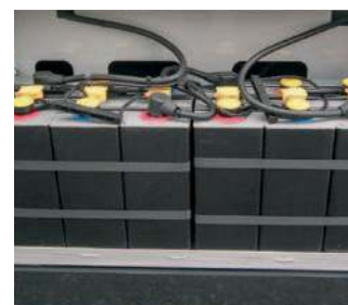
Ampio vano batterie per accogliere batterie di maggiore capacità