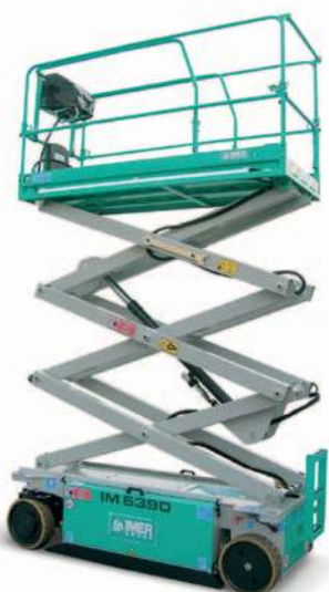
IM 6390 IM 6390 EX