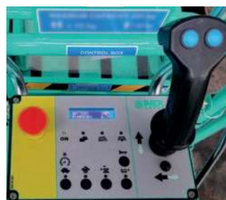
Quadro comandi sulla piattaforma con pulsanti capacitivi: semplicità e sicurezza di utilizzo